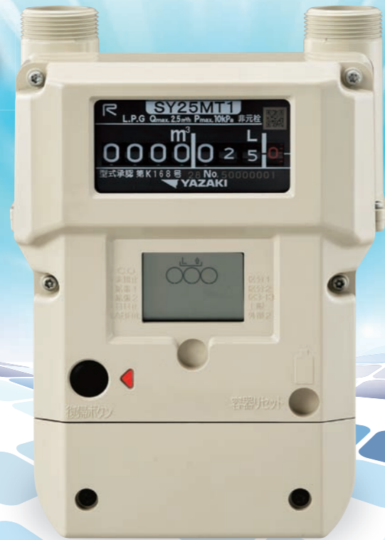
S型保安ガスメータ SY25MT1